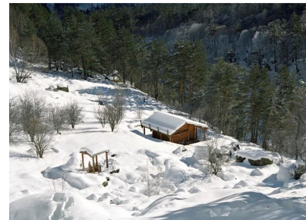
Цейское ущелье (ущелья с раной самобытной флорой и фауной)