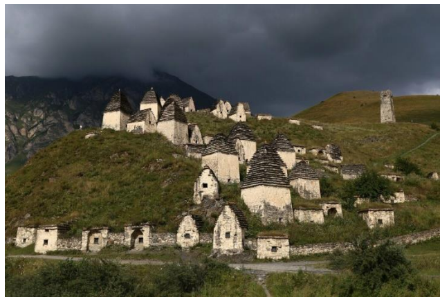
Даргавский историко-этнографический комплекс Город мертвых, филиал Национального музея