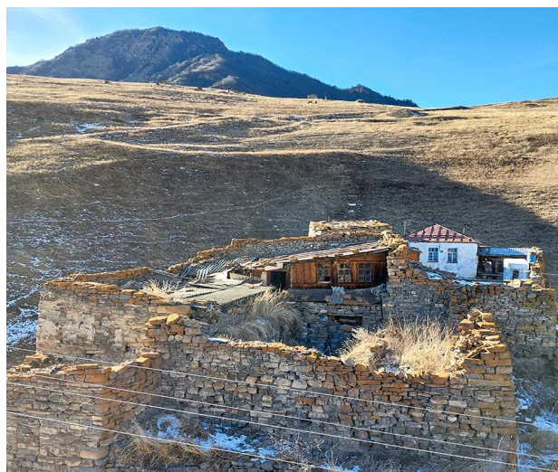
Аул Галиат : Место, связанное с легендой о Зарийском змее, который заключил селение в кольцо, и храбреце, спасшем жителей