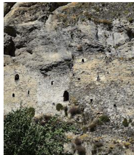
Оборонительные сооружения, вписанные в скалы

Осетия также славится своим гостеприимством, где гость считается «посланником Божьим» (Хуыцауы узаг), уникальной кухней и бережным сохранением народной культуры